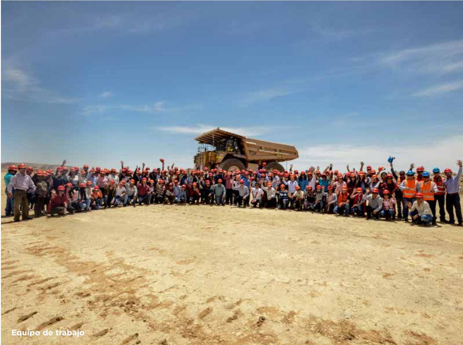
Equipo de trabajo

Respecto del ejercicio anterior, la planilla de la Sociedad ha incrementado en un 3.51% (de 4 727 trabajadores al cierre del 2 021 a 4 893 trabajadores al cierre del 2 022).