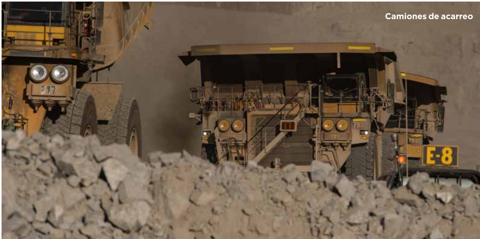
Camiones de acarreo