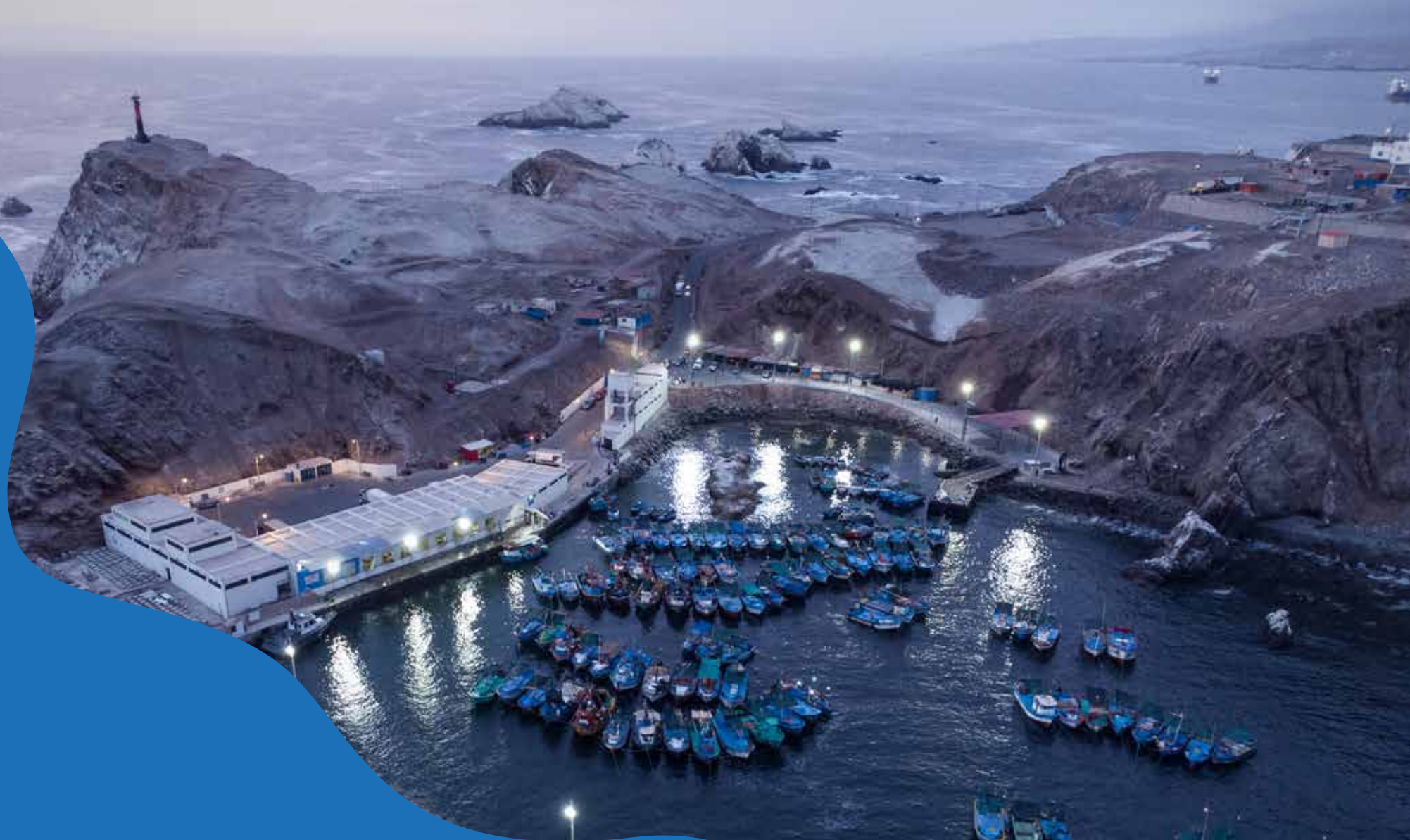
iluminación en muelle de Matarani