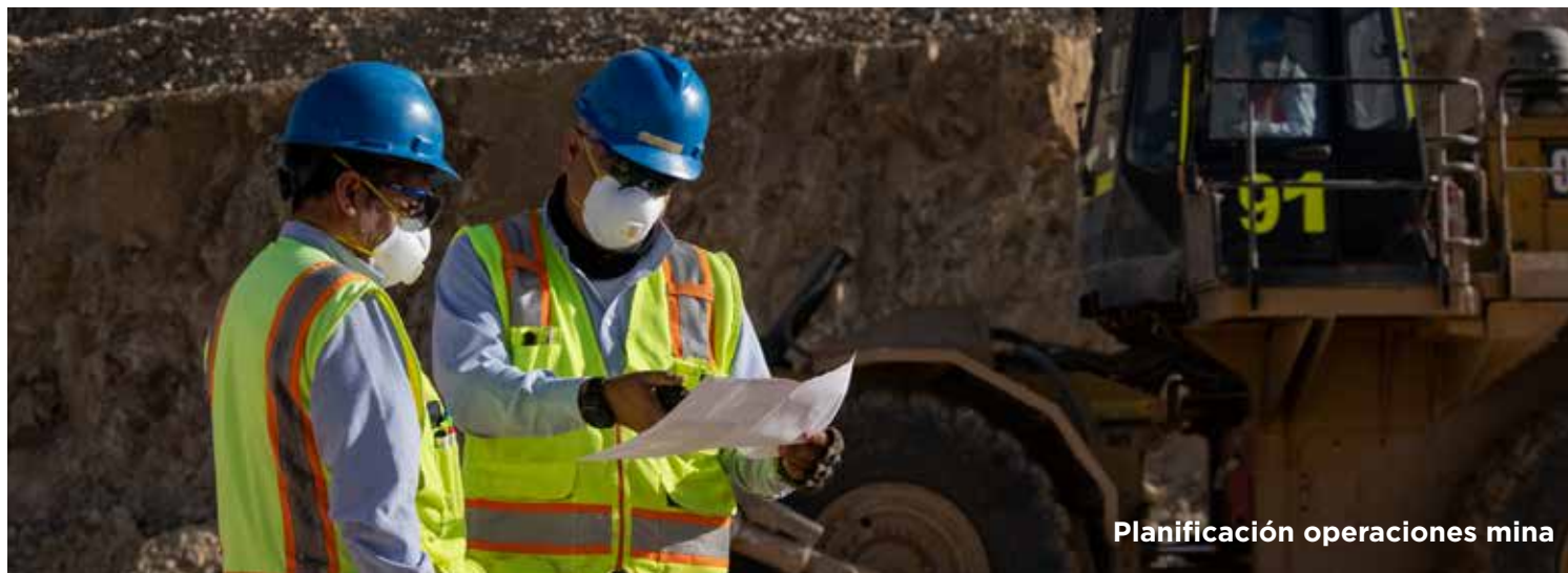
Planificación operaciones mina