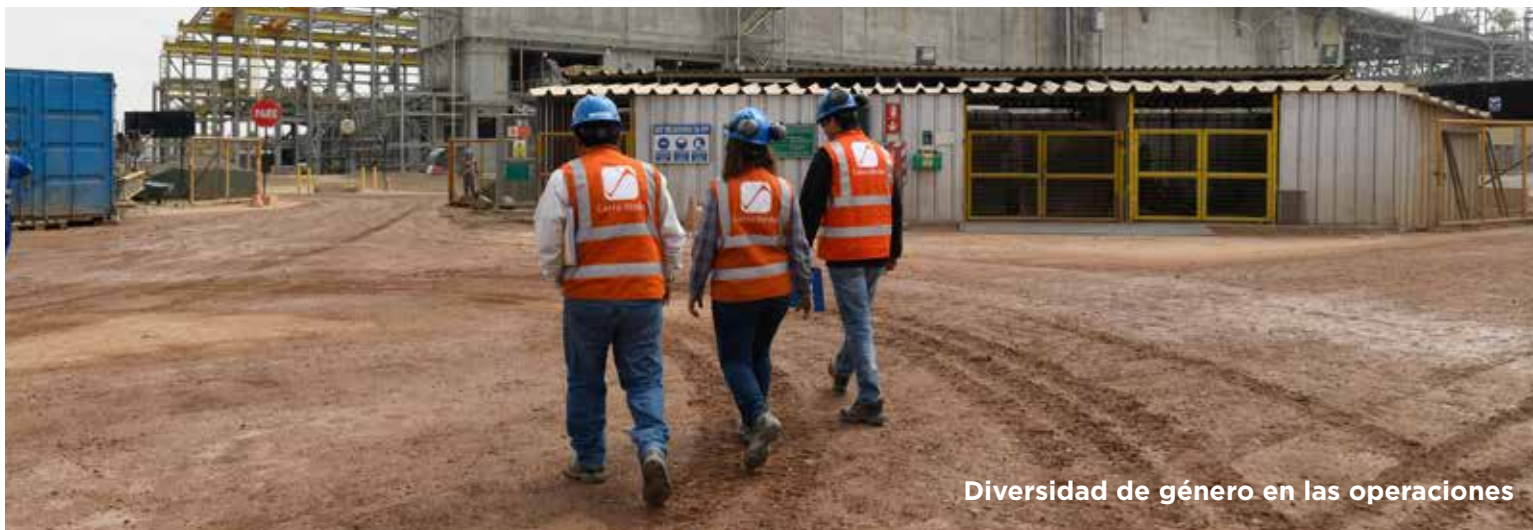
Diversidad de género en las operaciones