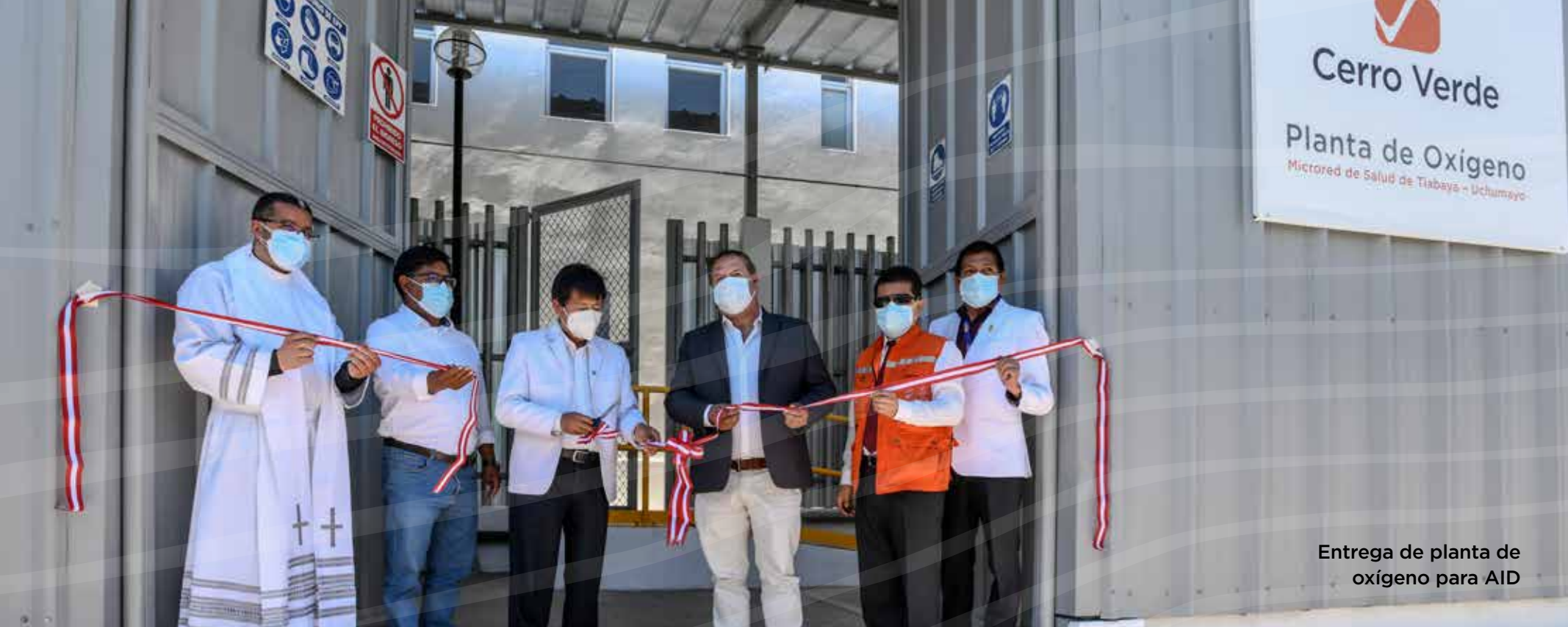
Entrega de planta de oxígeno para AID