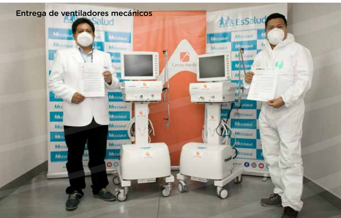
Entrega de ventiladores mecánicos