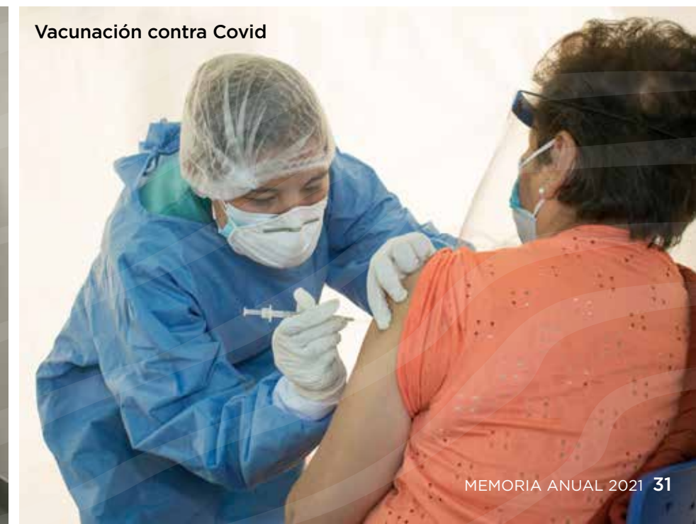
Vacunación contra Covid